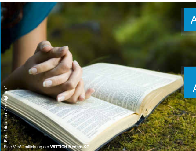
Eine Veröffentlichung der WITTICH Medien KG