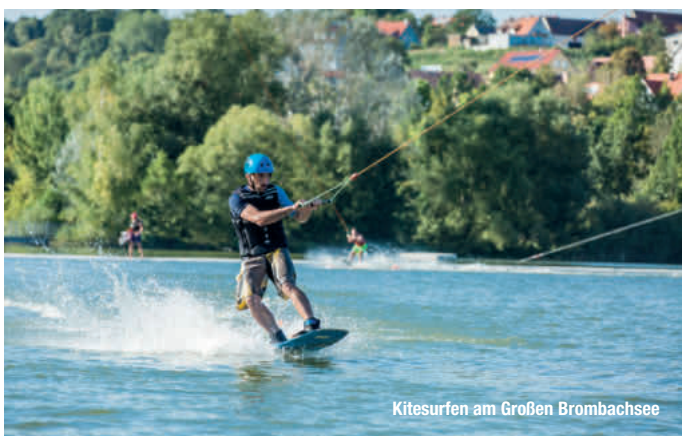
Kitesurfen am Großen Brombachsee