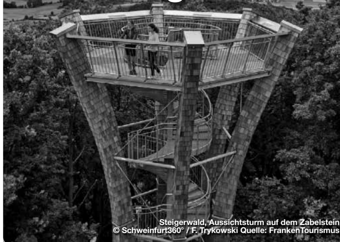
Steigerwald, Aussichtsturm auf dem Zabelstein

Wer sich fragt, was genau eigentlich Nachhaltigkeit bedeutet, dem ist das „Steigerwald-Zentrum – Nachhaltigkeit erleben“ im Oberschwarzacher Ortsteil Handthal eine Hilfe. Es ist eine der vielen Umweltbildungsstätten in den fränkischen Naturparks, die auf interaktive Art Wissenswertes vermitteln. Zu einem Perspektivwechsel lädt außerdem der „Baumwipfelpfad Steigerwald“ in Ebrach ein, der mit dem „Steigerwald-Zentrum“ über einen kurzen Wanderweg verbunden ist. Besonders gut ist die Aussicht auch auf dem Zabelstein: Die höchste Erhebung des nördlichen Steigerwalds wird von einem neuen, über 19 Meter hohen Aussichtsturm gekrönt. Oben weitet sich seine schlanke Holz-Stahl-Konstruktion zu einer „Krone“, von der sich ein Blick bis in die Haßberge und die Rhön bietet. TreffpunktDeutschland.de/steigerwald