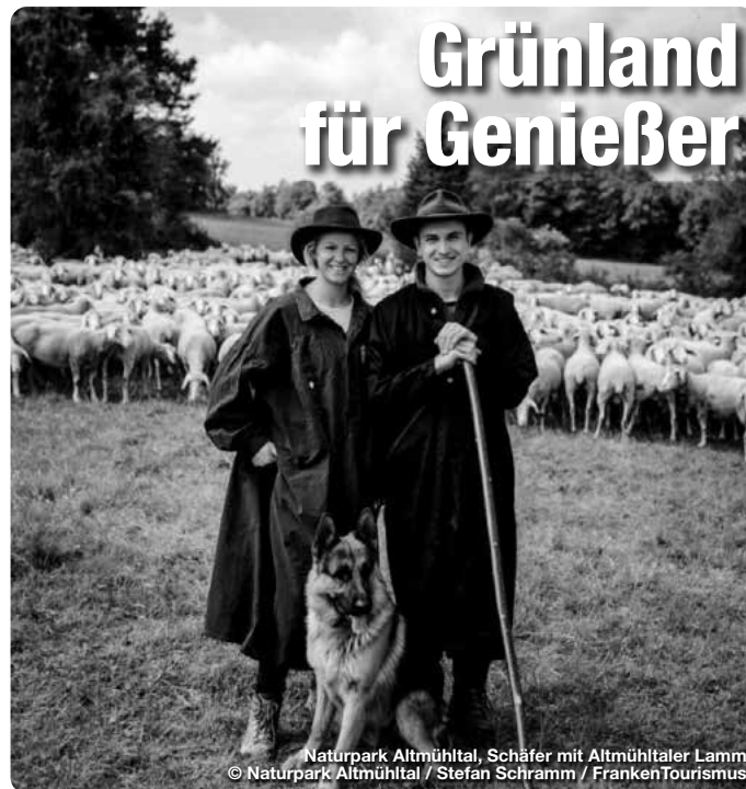
Naturpark Altmühltal, Schäfer mit Altmühltaler Lamm

Das Schöne an den fränkischen Naturparks ist, dass Landschaftsschutz hier sehr gut schmeckt! Viele Flächen, die wichtiger Lebensraum für Tiere und Pflanzen sind, können nur mit tierischer Hilfe erhalten werden. Deren Fleisch wiederum bereichert die regionale Küche. Vor allem Schafe spielen eine große Rolle, was Altmühltaler Lamm, Rhönschafe, Jura-Lamm, Frankenhöhe- oder Hesselberg-Lamm beweisen. Gesellschaft bekommen sie durch Beweidungs-Projekte wie das „Grünland Spessart“. Initiativen wie diese kommen nicht nur der Natur und den Genießern zu Gute: Auch für Landwirte und Schäfer bieten sich durch