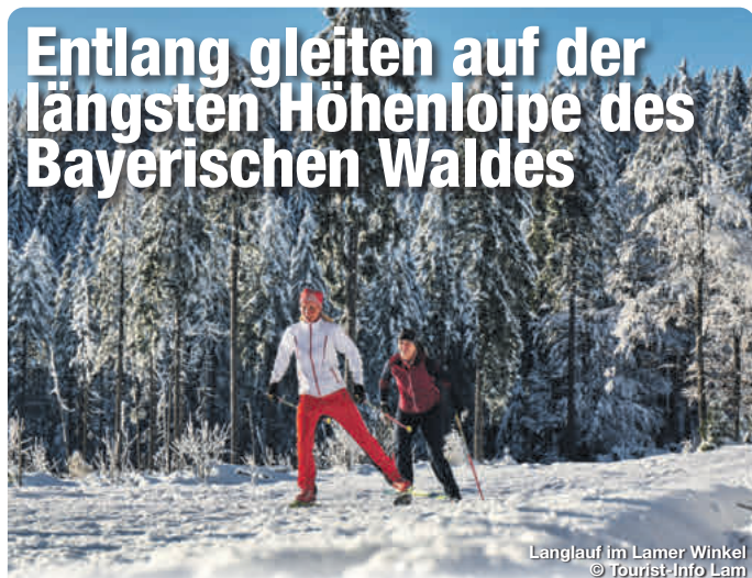
Langlauf im Lamer Winkel