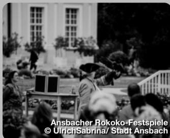
Ansbacher Rokoko-Festspiele