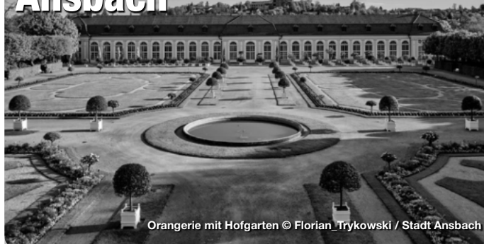
Orangerie mit Hofgarten

Der Hofgarten südöstlich der Residenz ist im französisch-barocken Stil gehalten. Die Anfänge des Gartens reichen in das 16. Jahrhundert zurück. Der Leonhart-Fuchs-Garten ist dem ehemaligen Leibarzt des Markgrafen und „Vater der Botanik“ Leonhart Fuchs gewidmet. Außerdem erinnert im Hofgarten ein Gedenkstein an die Stelle des Attentats auf Kaspar Hauser, dem berühmtesten Findelkind der Geschichte. Architektonischer Mittelpunkt des Hofgartens ist die schlossartige Orangerie, die 1726 bis 1728 von Carl Friedrich von Zocha nach französischen Vorbildern errichtet wurde. Promenade 33, Ansbach