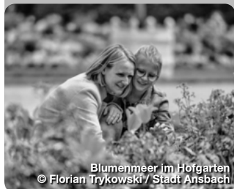
Blumenmeer im Hofgarten

Der Hofgarten südöstlich der Residenz ist im französisch-barocken Stil gehalten. Die Anfänge des Gartens reichen in das 16. Jahrhundert zurück. Der Leonhart-Fuchs-Garten ist dem ehemaligen Leibarzt des Markgrafen und „Vater der Botanik“ Leonhart Fuchs gewidmet. Außerdem erinnert im Hofgarten ein Gedenkstein an die Stelle des Attentats auf Kaspar Hauser, dem berühmtesten Findelkind der Geschichte. Architektonischer Mittelpunkt des Hofgartens ist die schlossartige Orangerie, die 1726 bis 1728 von Carl Friedrich von Zocha nach französischen Vorbildern errichtet wurde. Promenade 33, Ansbach