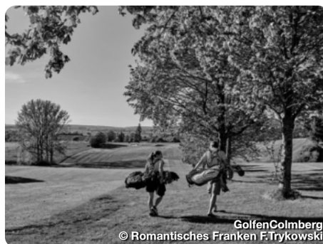
Golfen Colmburg

Mit gleich sechs Golfplätzen ist die Auswahl vor den Toren von Nürnberg groß. Allesamt liegen sie schön eingebettet in die Landschaft und haben noch viel Platz für Gastspieler. Auf den vier 18-Loch und zwei 9-Loch Anlagen kann man entspannte Runden genießen.