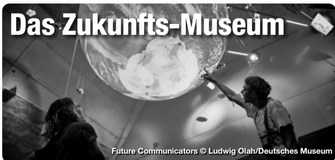
Future Communicators

Zukunft zum Anfassen. Im Deutschen Museum Nürnberg wartet schon heute die Welt von morgen Wie werden wir in 10, 20 oder 50 Jahren leben? Wie entwickelt sich Technik weiter - und vor welche Herausforderungen stellt uns das als Gesellschaft? Was wünschen wir uns? Welche Befürchtungen haben wir? Die Zweigstelle des Deutschen Museums im Herzen der Nürnberger Altstadt lädt zu einem spannenden und aufschlussreichen Blick in die Zukunft ein. Die Grundkonzeption einer Gegenüberstellung von „Science“ und „Fiction“ zieht sich dabei als roter Faden durch alle Bereiche der Ausstellung. Hier werden konkrete Projekte aus der aktuellen Forschung vorgestellt, die vielleicht schon morgen unser Leben beeinflussen könnten.