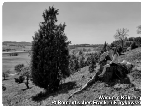
Wandern Kühberg

Ein großes Netz an Wanderwegen durchzieht den Naturpark Frankenhöhe. Rund um den Hesselberg kann man mit herrlicher Aussicht wandern. Rund um die historischen Städte von Dinkelsbühl, Feuchtwangen und Rothenburg o.d.T. stehen eigene Wegenetze bereit. Mit Geschichte wandern geht man auf dem KulturWanderweg Hohenzollern zwischen Rosstal und Langenzenn. Bei Stein und Zirndorf ist der Wanderweg Wallensteins Lager eine schöne Mischung aus Naturerlebnis und Geschichtspfad.