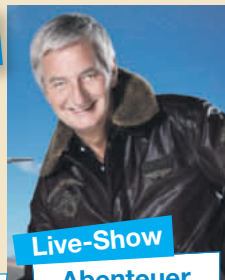
Live-Show Abenteuer Weltumrundung

Ausführlicher Reiseverlauf unter: www.schlagernacht-namibia.de