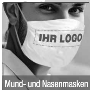
Mund- und Nasenmasken

Jetzt online konfigurieren und bestellen