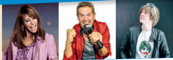
Ireen Sheer, Peter Wackel und Mickie Krause