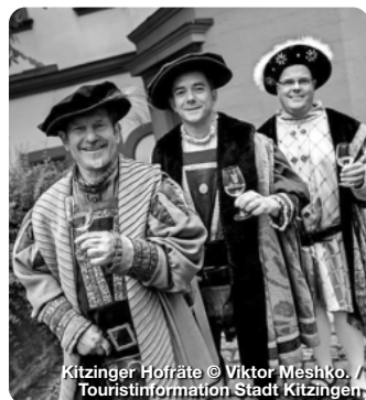
Kitzinger Hofräte