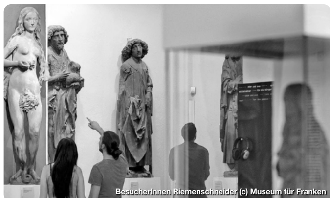
BesucherInnen Riemenschneider