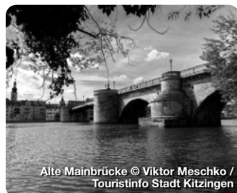
Alte Mainbrücke

TreffpunktDeutschland.de/tauberbischofsheim