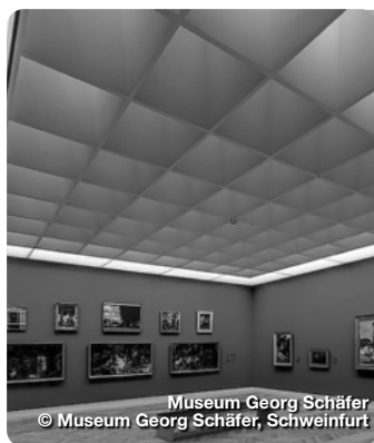
Museum Georg Schäfer