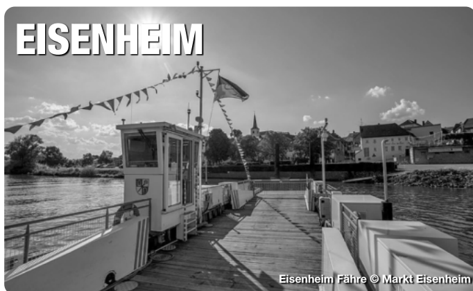
Eisenheim Fähre

Reiseführer. Reisemagazine. Freizeittipps.