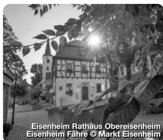
Eisenheim Rathaus Obereisenheim Eisenheim Fähre

Wer an der Mainschleife Zeit verbringt, der sollte unbedingt einen Abstecher in den Markt Eisenheim machen, genauer gesagt, in die beiden Dörfer Ober- und Untereisenheim. Wie zwei Perlen, aufgereiht an der Schnur des Maines, liegen die malerischen Dörfer am Beginn der Mainschleife. Geprägt wird die Gemeinde durch den Wein- und Obstanbau. 60 Winzerfamilien bewirtschaften im Voll- bzw. Nebenerwerb über 230 Hektar Weinberge. Auch sonst haben die beiden Orte einiges zu bieten. Ob im Tal direkt am Fluss oder in den Weinbergen rings um Eisenheim: Wanderer, Radfahrer, Wasserfreunde und Naturliebhaber finden hier paradiesische Zustände vor. TreffpunktDeutschland.de/eisenheim