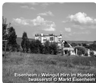
Eisenheim - Weingut Hirn im Hundertwasserstil