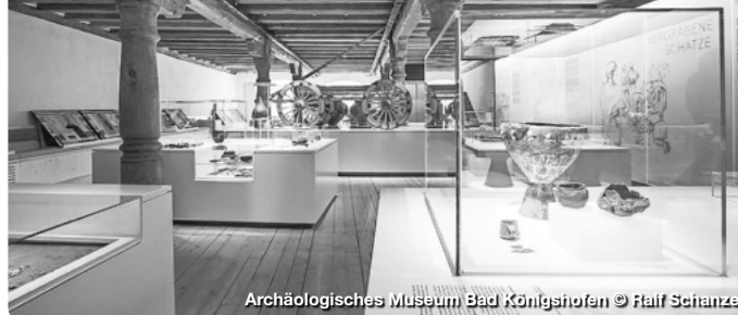
Archäologisches Museum Bad Königshofen