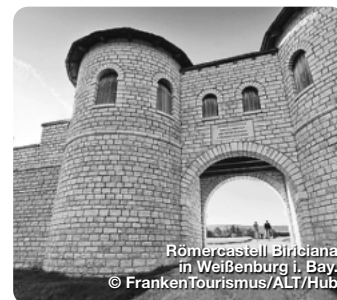
Römercastrum Birliciana in Weißenburg i. Bay.

Zahlreiche archäologische Funde zeugen vom einstigen Leben der Römer im heutigen Franken. Zum Beispiel verlief hier der Obergermanisch-Raetische Limes, die nördliche Grenze des römischen Reiches, auf einer Länge von 158 Kilometern. Seit 2005 ist das größte Baudenkmal Europas UNESCO-Weltkulturerbe. Entlang der ehemaligen Grenzanlagen haben Besucher vielfältige Möglichkeiten, das Erbe der antiken Großmacht zu erkunden. Rekonstruktionen römischer Bauten oder Museen mit Römer-Schätzen gibt es im Naturpark Altmühltal, im Fränkischen Seenland, im Romantischen Franken, im Spessart-Mainland oder auch im Fränkischen Weinland ( www.frankentourismus.de/unesco-welterbe/limes ). Die Spuren der Kelten werden heute noch an vielen Stellen sichtbar – ganz besonders entlang des Kelten-Erlebnisweges. Die Strecke ist 261 Kilometer lang und führt unter anderem durch die Haßberge und den Steigerwald bis zum Aischgrund. Auf dem Weg finden sich Überreste keltischer Siedlungen, Grabhügel und Museen mit altem keltischem Handwerk ( www.kelten-erlebnisweg.de ). TreffpunktDeutschland.de/franken