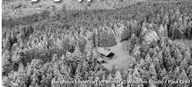
Berghaus Loderhart im Winter