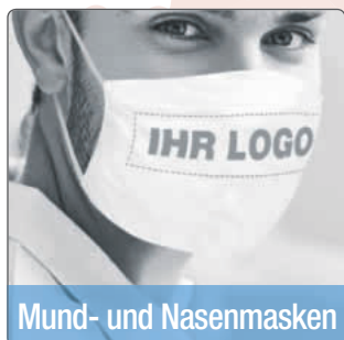
Mund- und Nasenmasken

Jetzt online konfigurieren und bestellen