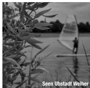
Seen Ubstadt Weiher

treffpunktDeutschland.de/ kraichgau-stromberg