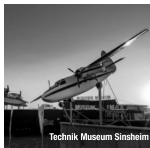
Technik Museum Sinsheim