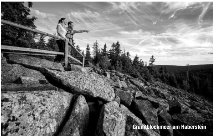
Granitblockmeer am Haberstein

Reiseführer. Reisemagazine. Freizeittipps.