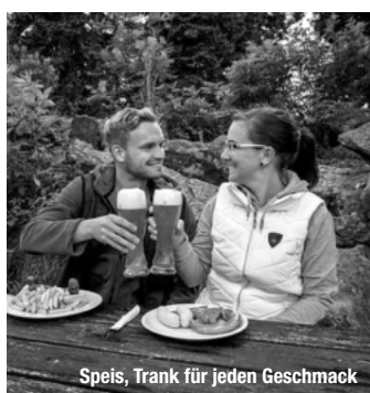
Speis, Trank für jeden Geschmack