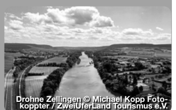
Drohne Zellingen