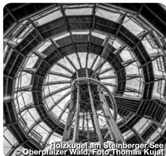
Holzkugel am Steinberger See

Huskyabenteuer – nordisches Feeling im Bayerwald Auf den zwei Huskyhöfen Dreisessel in Altreichenau und Haus Waldschrat in Frauenau können Urlaubsgäste mit den geselligen Hunden auf Tuchfühlung gehen sowie Workshops und Schlittenhunde-Ausfahrten buchen. Gerade im Winter, bei Eis und Schnee, sind die Hunde in ihrem Element – ein unvergessliches Erlebnis für die ganze Familie. TreffpunktDeutschland.de/bayerischer-wald