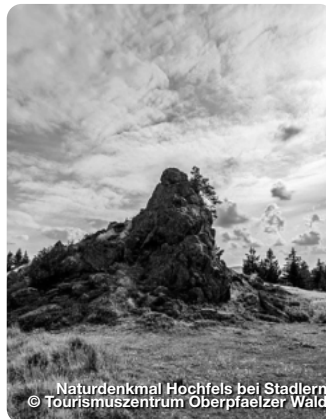
Naturdenkmal Hochfels bei Stadlern