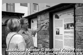
Laubhütte Kloster