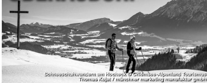
Schneeschuhwandern am Hochsee

Wenn die Wintersonne den Schnee glitzern lässt, als wären tausende von Diamanten verstreut. Wenn die weiße Pracht das Herz des Wintersportlers höherschlagen lässt und das atemberaubende Bergpanorama einem die Sprache verschlägt - dann beginnt er: der Winter im idyllischen Oberaudorf. Der kleine Luftkurort Oberaudorf im Voralpenland bietet jede Menge Wintererlebnisse fern ab von großen Touristenmassen. Zur Auswahl stehen bestens präparierte Pisten, kurvenreiche Rodelbahnen, aussichtsreiche Langlaufloipen sowie spannende Fackelwanderungen. Wellnessangebote, Gaumenfreuden und diverse Einkaufsmöglichkeiten machen Oberaudorf zu einem optimalen und einzigartigen Winter-Urlaubsort.