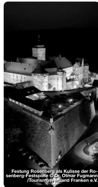
Festung Rosenberg als Kulisse der Rosenberg-Festspiele