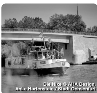
Die Nixe © AHA Design, Anke Hartenstein / Stadt Ochsenfurt