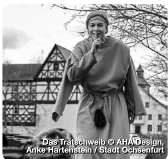
Das Tratschweib © AHA Design, Anke Hartenstein / Stadt Ochsenfurt