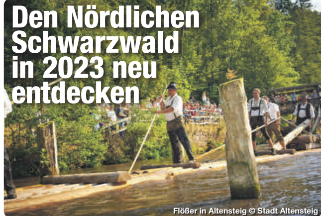
Flößer in Altensteig

Ob Wandern, Radfahren, aktiv sein oder entspannen – im Nördlichen Schwarzwald gibt es für alle Bewegungshungrigen, Entdecker, Genießer und Abenteurer das ganze Jahr über viel zu erleben. Zertifiziert als nachhaltiges Reiseziel, sind viele Ausflugsziele oder Wanderwege im Nördlichen Schwarzwald dank der guten ÖPNV-Anbindung, den E-Leihmobilen und den „Erlebnislينien“ – den regionalen Bus- und Bahnlinien – ganz einfach