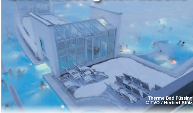
Therme Bad Füssing

Sieben Thermen in fünf Heil- und Thermalbädern stehen für nachhaltige Entspannung im Bayerischen Golf- und Thermenland. Sie sind Orte für nachhaltige Entspannung und Auszeit. Wissenschaftlich belegt hilft Heilwasser bei Rheuma, Verdauungs-, Stoffwechsel- und Wirbelsäulenproblemen ebenso wie bei Stress, Schlaflosigkeit oder Mattigkeit. Demnach ist Winter nicht nur Wellnesszeit, sondern auch Zeit, die eigene Gesundheit wieder ins Gleichgewicht zu bringen. Ob in Bad Füssing, Bad Griesbach, Bad Birnbach, Bad Gögging oder Bad Abbach – im Bayerischen Golf- und Thermenland wird die richtige Balance zwischen Gesundheit und ganzheitlichem Vital- und Aktivurlaub gelebt.