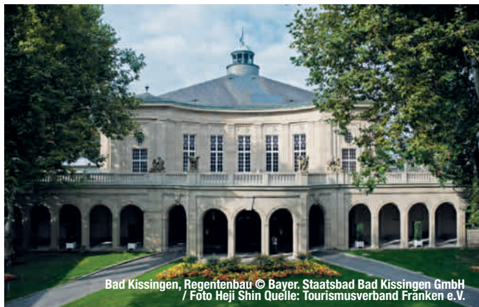
Bad Kissingen, Regentenbau