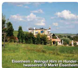
Eisenheim - Weingut Hirn im Hundertwasserstil