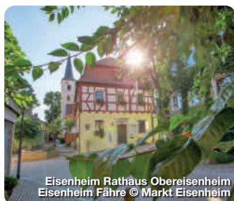
Eisenheim Rathaus Obereisenheim Eisenheim Fähre

Wer an der Mainschleife Zeit verbringt, der sollte unbedingt einen Abstecher in den Markt Eisenheim machen, genauer gesagt, in die beiden Dörfer Ober- und Untereisenheim. Wie zwei Perlen, aufgereiht an der Schnur des Maines, liegen die malerischen Dörfer am Beginn der Mainschleife. Geprägt wird die Gemeinde durch den Wein- und Obstanbau. 60 Winzerfamilien bewirtschaften im Voll- bzw. Nebenerwerb über 230 Hektar Weinberge. Auch sonst haben die beiden Orte einiges zu bieten. Ob im Tal direkt am Fluss oder in den Weinbergen rings um Eisenheim: Wanderer, Radfahrer, Wasserfreunde und Naturliebhaber finden hier paradisiische Zustände vor. TreffpunktDeutschland.de/eisenheim