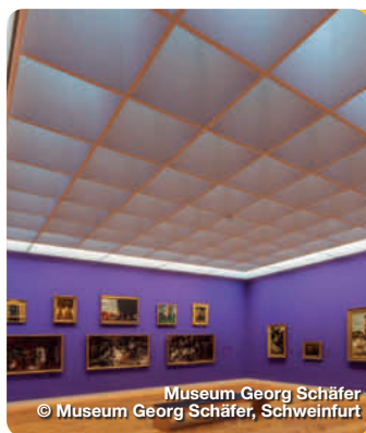
Museum Georg Schäfer © Museum Georg Schäfer, Schweinfurt